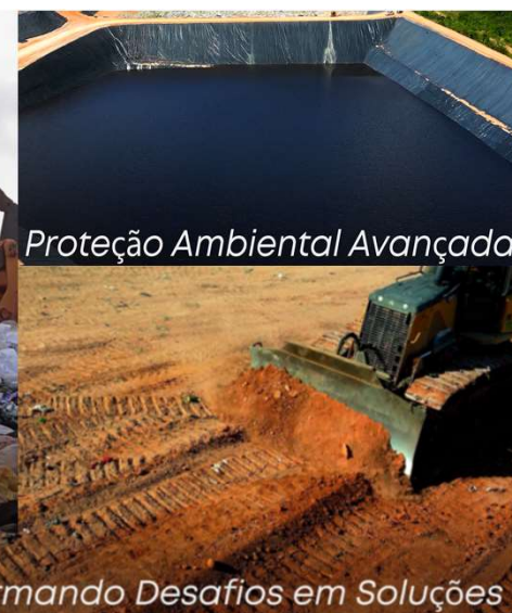
Proteção Ambiental Avançada