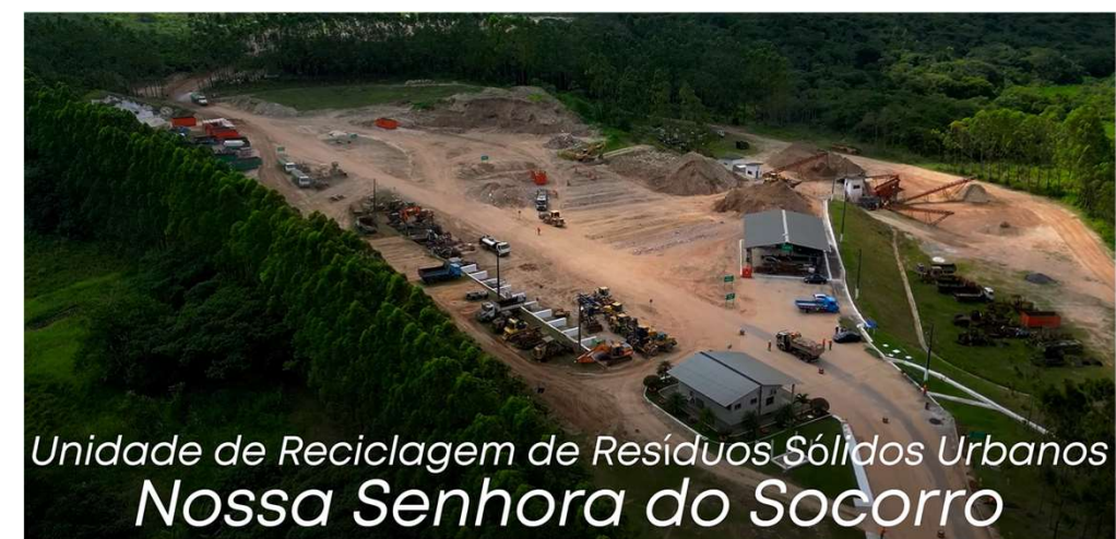
Unidade de Reciclagem de Resíduos Sólidos Urbanos Nossa Senhora do Socorro