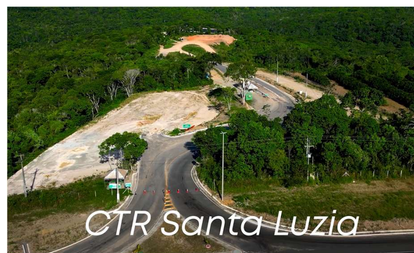
CTR Santa Luzia