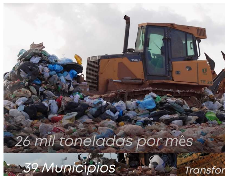
26 mil toneladas por mês

Operamos desde 2012 a primeira unidade de RCD no Estado de Sergipe, onde a matéria inerte coletada era transformada em agregado reciclado para ser utilizado na construção civil. O processo é feito por técnicos especializados e equipamentos de ponta, dando destino final ecologicamente correto e seguro a essa matéria.